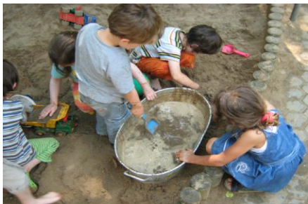
Freispiel auf dem Spielplatz

In einem selbständigen Hantieren und Ausprobieren kann das Kind von Anfang bis Ende seine Ideen ausleben und es erfährt ein positives Selbstwertgefühl. Das ist eine wichtige Erfahrung, um Mut zum Ausprobieren zu bekommen. Zudem erlebt das Kind hierbei seine Grenzen.