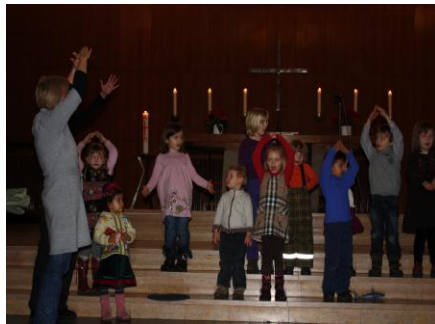
Gottesdienst zum 2. Advent

In unmittelbarer Nähe der Kindertageseinrichtung befinden sich drei Hochschulen. Die Eltern der Kinder sind somit häufig Studenten oder andere Hochschulangehörige. Manche stammen auch aus anderen Ländern. Gegenseitige Toleranz - bezüglich Konfession, Herkunft, Bräuchen und Ritualen - sind in unserer Einrichtung von Bedeutung. Ist es das erste Kind in einer Familie, so besteht intensiver Gesprächsbedarf. Nicht nur das Kind, auch die Eltern müssen zu Schritten des Loslassens ermutigt werden. Eltern von behinderten Kindern haben zusätzliche Aufgaben zu bewältigen, bei denen sie kompetente und einfühlsame Unterstützung benötigen. Als evangelische Kindertageseinrichtung wollen wir nicht allein die Betreuung der Kinder absichern, sondern ein Stück gemeinsamen Weges mit den Kindern und ihren Eltern gehen, zur Lösung von Lebens-, Glaubens- und Erziehungsfragen beitragen bzw. im Bedarfsfall fachliche Hilfe vermitteln. Eine wichtige Ressource ist hierbei die Einbindung